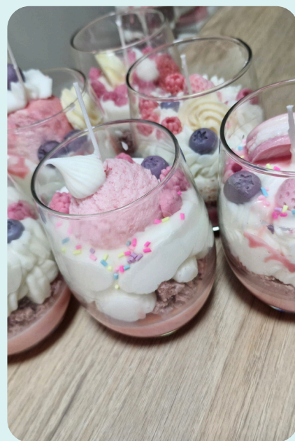
Veladora bola de helado