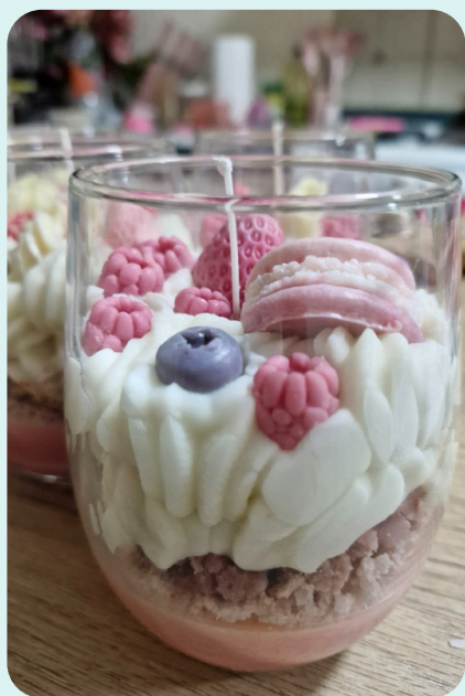
Veladora postre $250.00