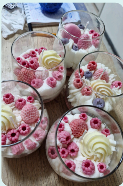
Vista desde arriba