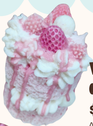
Vela pastel de doble altura $200.00